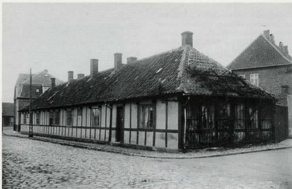
Fig. 1. Marie Kofoeds stiftelse i 1922.