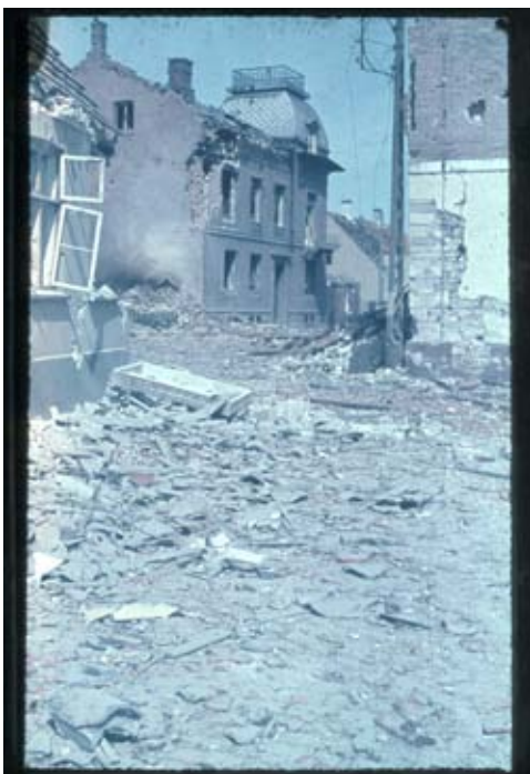
Fig. 17. Det ødelagte dommerkontor – med den intakte »kiggenborg« – set fra Havnen hen mod Nørregade. Til højre P. Bergs pakhus hvor hele kornlageret brændte. Foto måske 9. eller 10. maj – før oprydningen for alvor er sat i gang.

des, uanset at der endnu forekommer enkelte Sprængninger i Ammunitionsskibet.