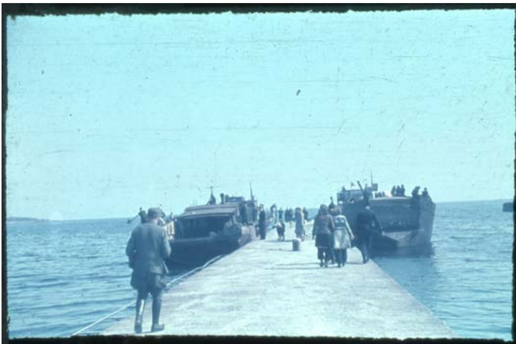
Fig. 2. Tyske transportpramme eller landgangsbåde er fortøjet ved Klokkemolen i Nexø Havn. Man kan se i havnens protokoller, at der 5. og 6. maj ankom ca. 10.000 civile og militære flygtninge.

I Nexø By var før Kapitulationen kun faa, tyske Styrker placeret, og der var ikke i Byen eller dens umiddelbare Nærhed foretaget Forsvarsforberedelser, dog fandtes i Havnen til Stadighed mindre tyske Marinestyrker og ofte ankrede større tyske Enheder op paa Reden.